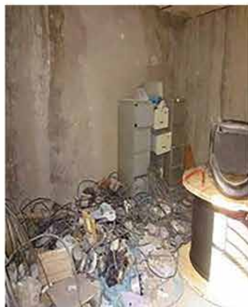
• قبل از اجرای 5S