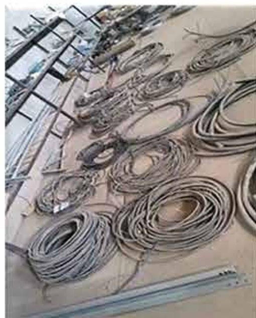
• قبل از اجرای 5S