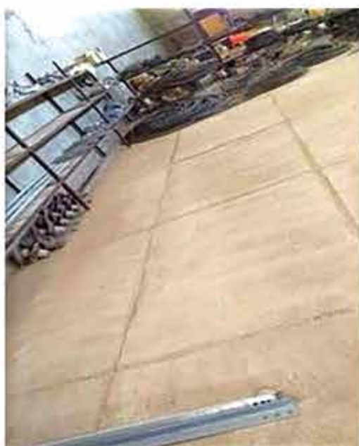
• بعد از اجرای 5S