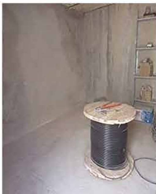
• بعد از اجرای 5S